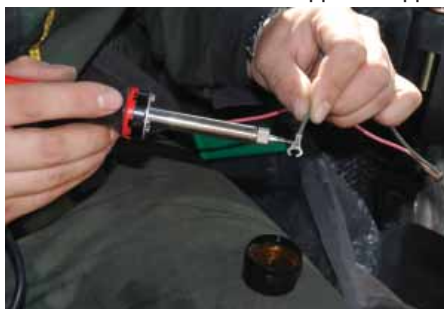
Подключение к питанию

шло только с питанием. Если соединение всех компонентов системы между собой происходит через стандартные байонетные разъемы, то для подключения питания имеется просто два провода с предохранителем. Приходится делать контакты самим. Для этой цели мы прихватили с собой паяльник и все необходимое для