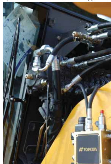
Гидросистема машины без давления

раз и отвечают за коррекцию давления в рабочих гидроцилиндрах в зависимости от информации, подаваемой на них из панели управления. Сориентировав клапана по расположению входных и выходных отверстий на месте крепления можно приступать к монтажу дополнительных гидролиний. В зависимости от конструкции исходной гидравлической системы машины состав и схема дополнительной гидравлики может варьироваться, поэтому мы обращаемся к инструкции по установке гидравлического комплекта на грейдер Volvo 900 серии. Концепция системы Торсон состоит в том, что дополнительный гидравлический комплект не вносит изменений в принципиальную схему базовой системы, а является дополнительным контуром, соединяющимся с базовой гидравликой с помощью Т-образных соединительных фитингов (по сути своей тройников). Поэтому мы отыскиваем среди запчастей именно эти тройники и начинаем внедряться