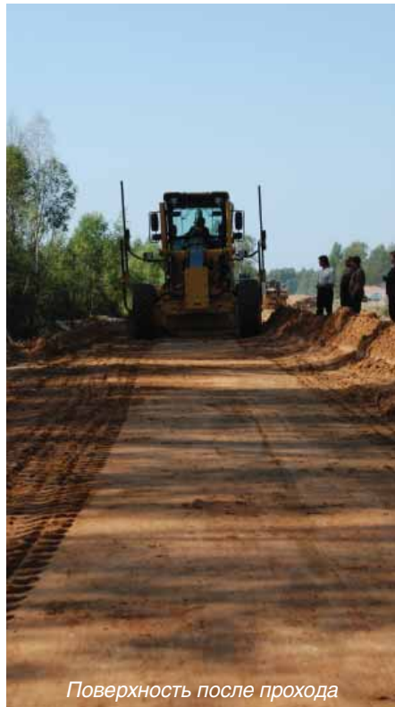
Поверхность после прохода

На левой стороне дороги мы пробуем конфигурацию системы, работающую по двум лазерным сенсорам. В этом случае датчик поперечного уклона не используется. Выставив с помощью геодезиста нож отвала на требуемую проектом отметку, как и в предыдущем случае, фиксируем рабочую лазерную плоскость. На другом конце отвала поднимем второй датчик 9130 на то же расстояние от кромки ножа, что и первый, это обеспечит нам параллельность ножа к опорной лазерной поверхности. Включаем автоматический режим и отвал принимает нужное положение. Можно начинать работу. Грейдер побежал вперед, ровняя за собой песок, и вскоре испытываемый участок закончился. Мы всей толпой смотрим результат. Ровненько, но на поверхности четко видна волна. Множество вопросительных лиц обратились в нашу сторону. Нам ничего не остается, как объяснить происходящее. Обращаем внимание сгрудившихся специалистов на полученную поверхность: видите срез, а в нем глина? А попробуйте наступить сюда. Нога пружинит? Вот вам и ответ. Насыпали суглинок вместо речного песка и сразу не заметили. Бульдозерист ровняет то, что высыпал самосвал и не его работа проверять качество материала. Теперь