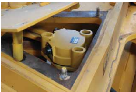
Установка датчика поворота отвала

В первую очередь были выполнены сварочные работы, необходимые для фиксации датчиков на планировочном отвале грейдера и транспортировочных кронштейнов. Потом началась установка сенсоров. Первым стал датчик продольного уклона машины. На всех моделях грейдеров Volvo 900 серии эти устройства ставятся под кабиной. Повозившись немного с демонтажем стеклоочистителя, датчик (он же компоновочный узел, собирающий информацию с других senso-