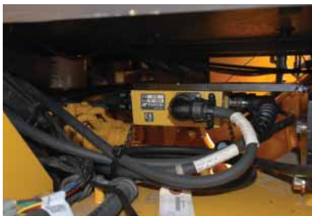
Установка датчика продольного уклона

теплой, поэтому инсталляция стала одним удовольствием.