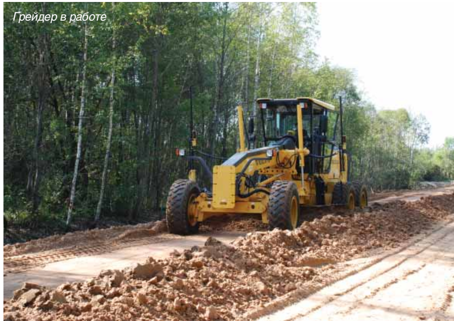
Грейдер в работе

спеша побрели в сторону гостиницы. На следующий день нам предстоит запуск системы в эксплуатацию на дороге на Великий Мох. От Углича до Великого Мха около 70 километров дороги, основная часть которой проходит через живописные леса перемежающиеся небольшими деревеньками. Ехать утром по практически пустой дороге одно удовольствие, и мы очень быстро оказались на месте. Дорога до поселка прокладывается через сложный по рельефу участок местности. Земли здесь низкие и заболоченные. Строителям приходится насыпать и выравнивать огромные массы песка для достижения необходимого слоя основания дороги. Именно на этом участке было решено испытывать систему Торсон и проводить стартовый тренинг специалистов УДСУ. На испытания собралось большое количество народу. Главный инженер, главный механик, прорабы со всех участков и, конечно же, геодезист. Можно начинать. Первое, что мы делаем, выбираем безопасное место для лазерного нивелира. От стабильности его работы будет зависеть стабильность положения опорной поверхности, а значит точность работы системы. После установки лазера его необходимо сориентировать. Так как мы будем работать с наклонными плоскостями, неправильная ориентировка относительно продольного и попе-