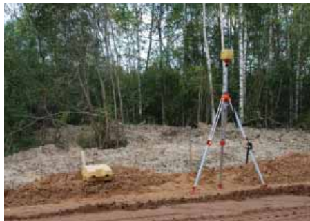
Построитель лазерной плоскости в рабочем положении

Сегодня же это тихий провинциальный городок преимущественно одноэтажной застройки. В середине дня в центре города очень спокойно и тихо. Даже экскурсионные группы, постоянно приезжающие по Волге на пароходах и повторяющие на разных языках историю города, не нарушают размеренный и неторопливый темп жизни. Пользуясь свободными минутками, мы прогулялись по паркам центральной части города, территории бывшего кремля, прошли мимо княжеских палат, сохранившихся с 1481 года, мимо Свято-Воскресенского монастыря и добрались до Набережной улицы. Эта улица самая людная, ведь здесь находится Углическая пристань, куда постоянно пристают пароходы. Здесь находятся длинные ряды палаток с русскими сувенирами, музеи и небольшие ресторанчики, в одном из которых мы чудесно поужинали. День подошел к концу. Сытые и довольные прошедшим днем мы не